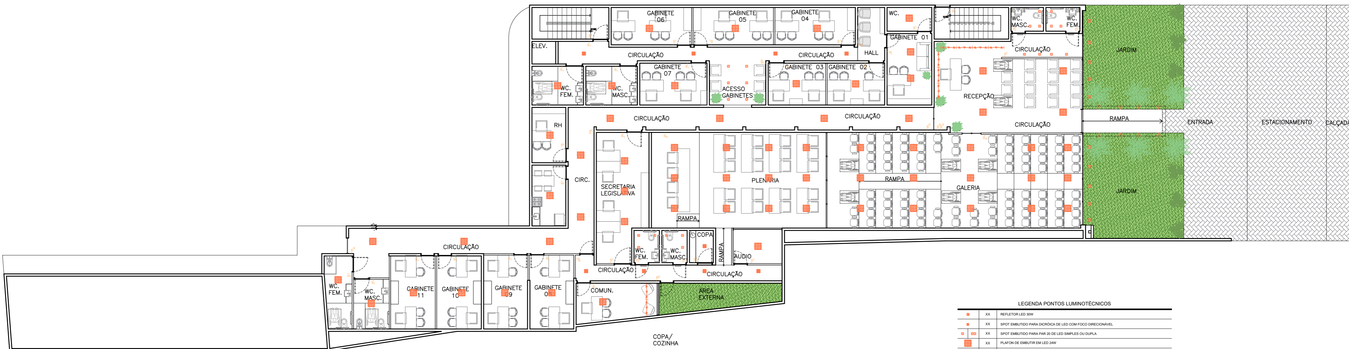
01 PLANTA TÉRREO ESCALA 1:150