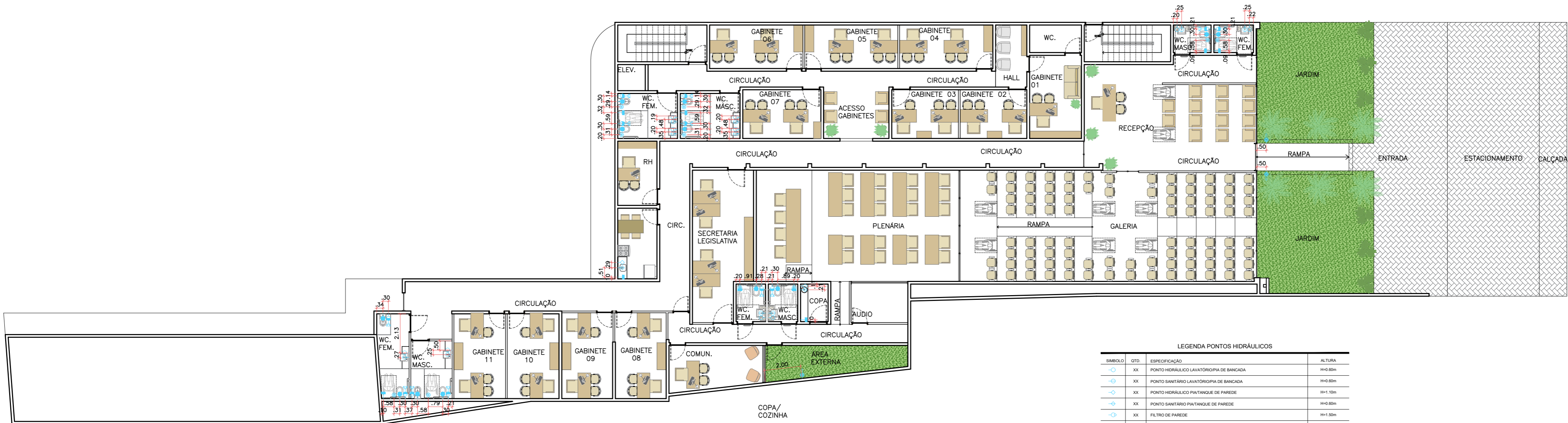
01 PLANTA TÉRREO ESCALA 1:150