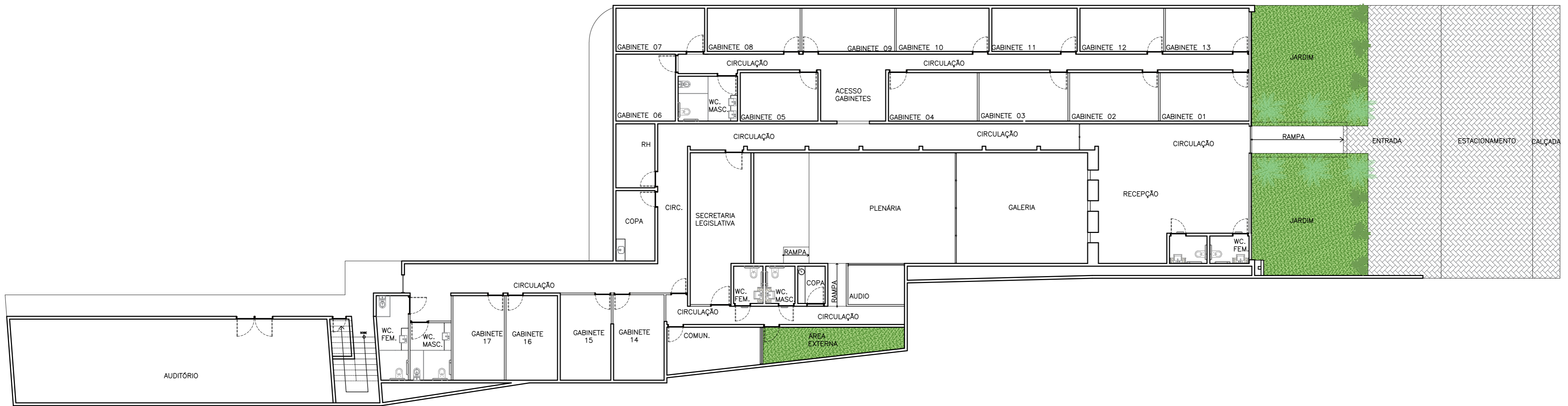
01 PLANTA TÉRREO ESCALA 1:150